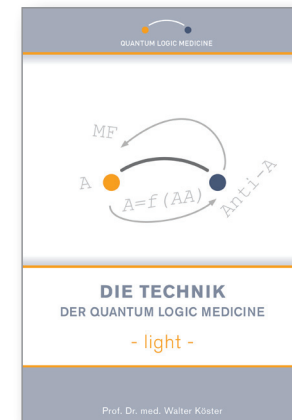
Die Technik der Quantum Logic Medicine - light -

Wie Sie sehen werden, ist diese Arznei quantenlogisch exakt erarbeitet worden. Die daraus erwachsende therapeutische Sicherheit erhalten Sie nicht, wenn Sie diese Arzneidarstellung jetzt klassisch oder nach Gutdünken verwenden. Nur wenn Sie diese Struktur unter exakter Anwendung der quantenlogischen Technik präzise einsetzen, werden Sie deren erstaunliche Sicherheit ernten. Ansonsten wird Ihnen die Darlegung eher wie eine Spielerei erscheinen und Sie in der Light-Version auch noch zu Oberflächlichkeit verleiten. Nichts aber schadet Ihrem Erfolg mehr in dieser physikalischen Medizin. Sie werden Schiffbruch erleiden und dies ggf. der Quantum Logic Medicine anlasten. Das aber wäre ein Irrtum. Bei einem MRT oder einer Autoreparatur achten Sie die wissenschaftlichen Grundsätze schließlich auch, weil sie wissen, dass Sie ohne diese "baden gehen". Sie bauen einen Ferrari-Motor doch auch kaum in ein Volkswagen-Chassis ein. Es würde Sie viel Aufwand kosten mit wenig Effekt. Dafür ist Ihre Mühe zu schade. Eine quantenlogisch erarbeitete Arznei einzusetzen, bedeutet eben noch lange nicht, quantenlogisch zu arbeiten. Dazu gehören vor allem präzise Exaktheit, perfekte Technik und natürlich auch Erfahrung und Routine in dieser Methode.