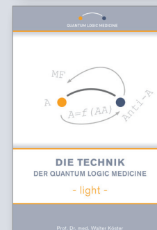
Die Technik der Quantum Logic Medicine - light -