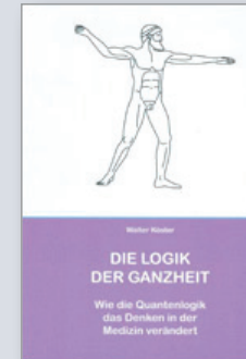
Logik der Ganzheit

Sehr zu empfehlen ist die Lektüre der folgenden Literatur: